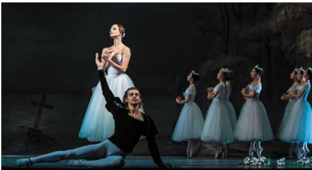
«Жизель» с участием солистов Большого театра Нины Капцовой и Александра Волчкова