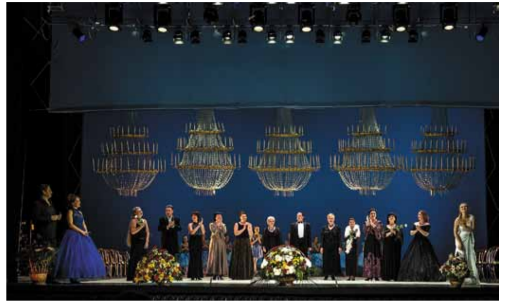
Театр принимает поздравления

А 10 октября в балете «Баядерка», главные партии исполнили специально приглашённые из Германии выпускница Вагановской академии Санкт-Петербурга, первая солистка