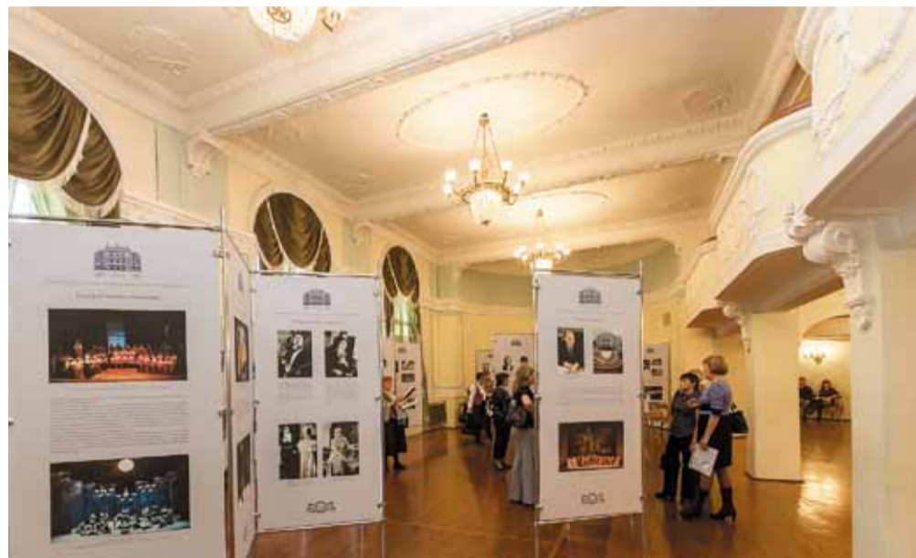
Большая экспозиция, посвящённая юбилею театра, представлена и в фойе бельэтажа

Проект знакомит екатеринбуржцев с творчеством известных театральных ма-