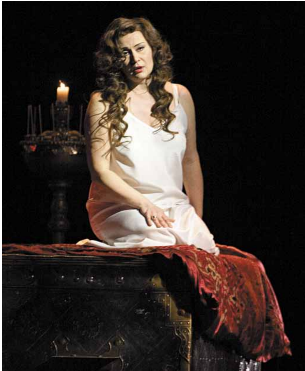
Светлана Пастухова в роли Любаши в опере «Царская невеста», постановка 2002 года

– Это была постановка 2002 года известного режиссёра Дмитрия Бермана. Счастлива, что