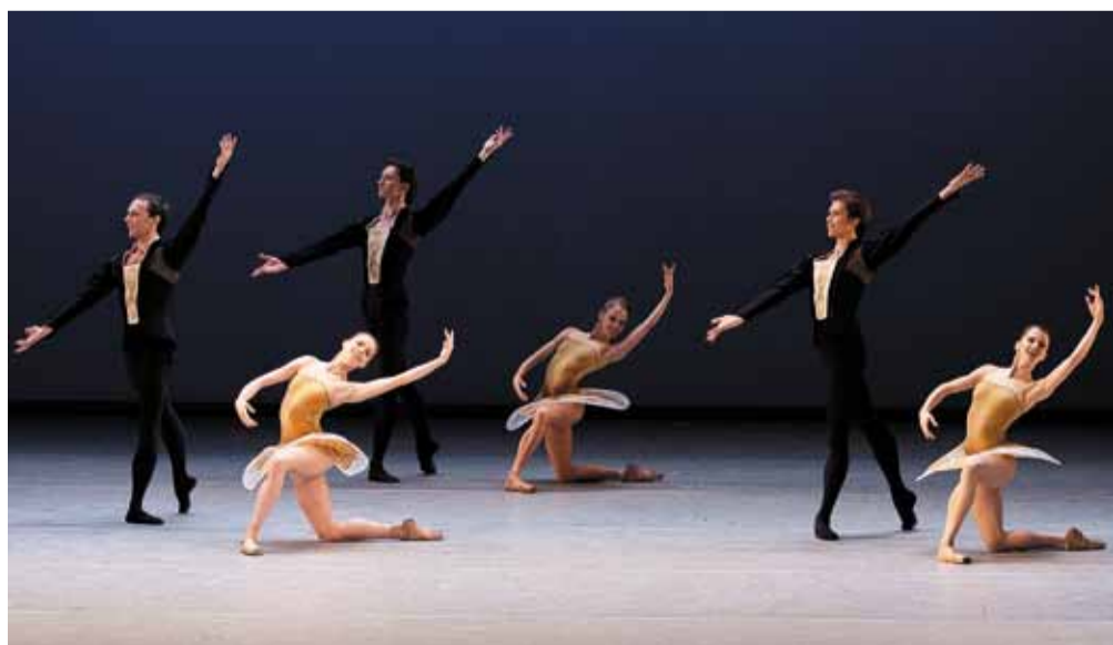
«Классическая симфония».

Гастроли Большого театра пройдут при поддержке компании «Nespresso» в рамках открытия бутика в Екатеринбурге.