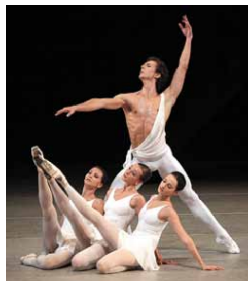
«Аполлон Мусaget».