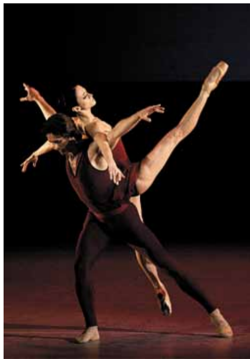
«Dream of dream».