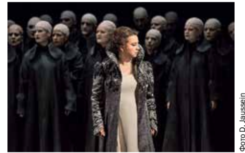
Турандот в Опере Ниццы в 2014 году

Отметим, театр оперы и балета не изменит своего облика, его внешний вид останется в классических традициях.